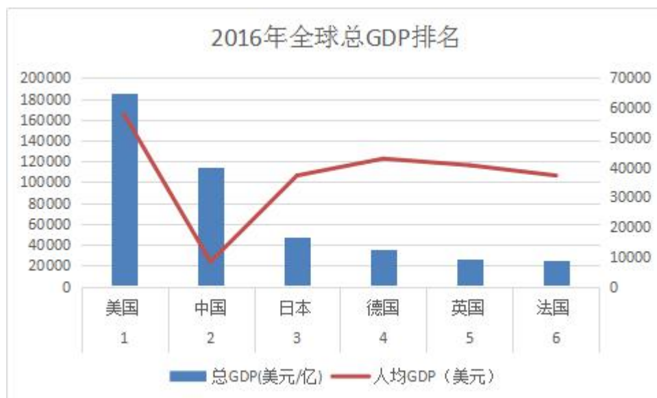
图 2 2016 年全球 GDP 排名