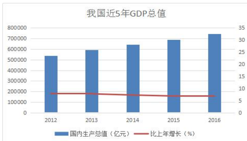
图 1 2012--2016 年国内生产总值